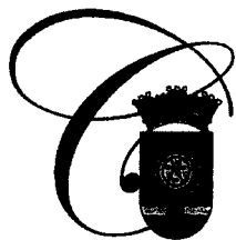
Camuy, Ciudad Romántica